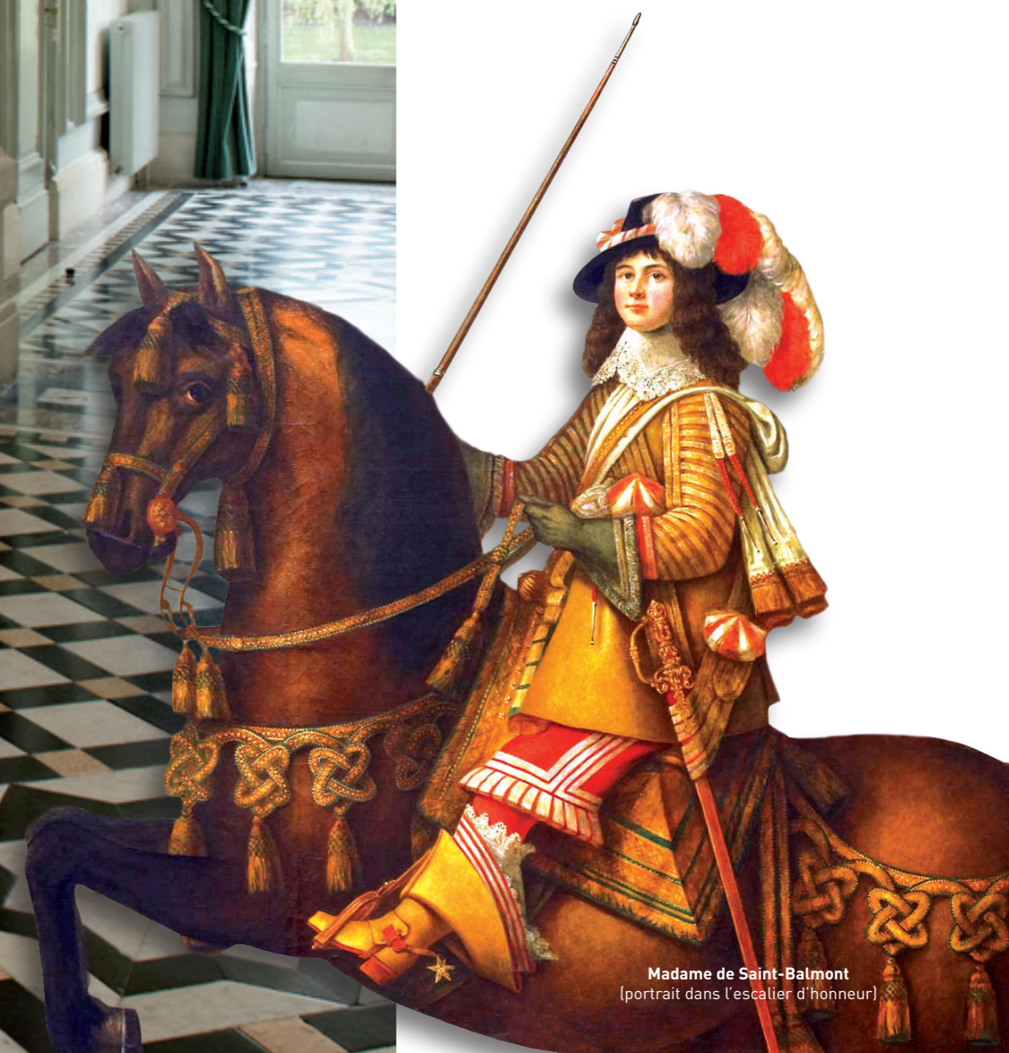
Madame de Saint-Balmont (portrait dans l'escalier d'honneur)

La mairie de Mantes-la-Ville, propriétaire, ayant décidé de le vendre, il risquait d'être privatisé et de refermer ses portes. C'est pourquoi « Connaissance de la Meuse » l'a acheté en 2011 afin d'en garantir l'usage public et de le sauvegarder.