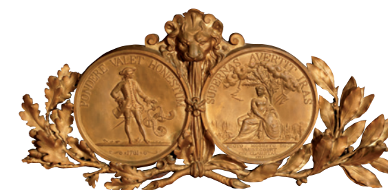
Détail de la cheminée